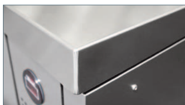
Opción de cubierta plana

Todas las dimensiones están redondeadas a la siguiente medida en milímetros.